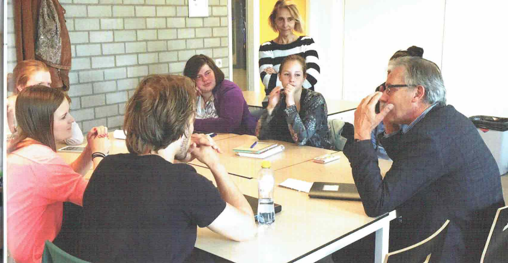
'Deze studenten zullen in hun werk met mensen met dementie in aanraking komen. Als zij nu al een ander beeld krijgen van dementie helpt hen dat in hun latere werk.'