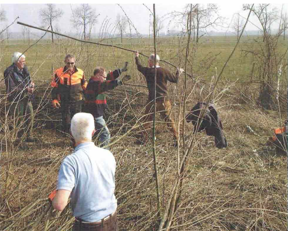
Mensen met dementie aan het werk bij Landschapsbeheer.

'Ook reguliere dagbesteding kan worden gegeven vanuit de visie van DemenTalent'